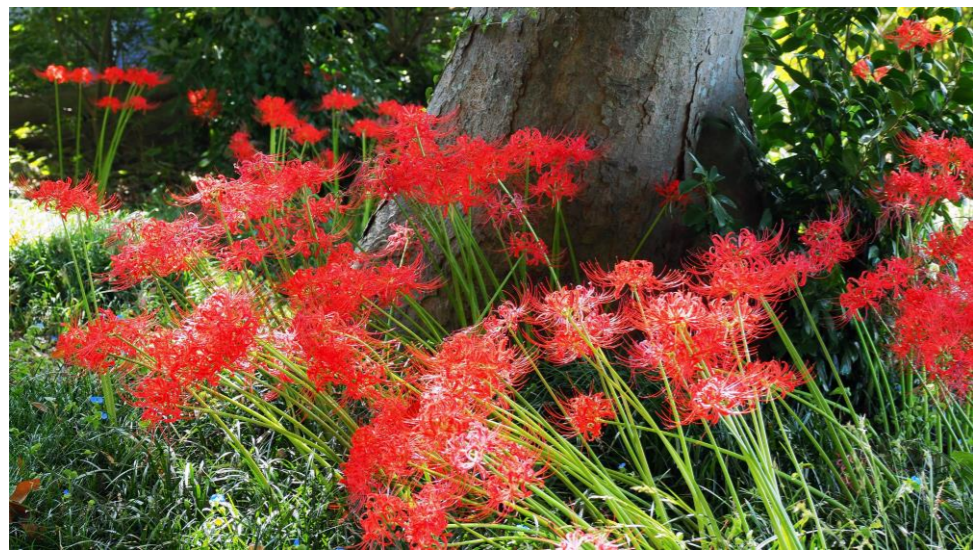
「彼岸花」 白山市吉田町神社(R7年10月撮影)