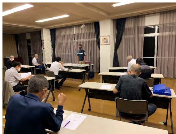
執行部会での協議風景